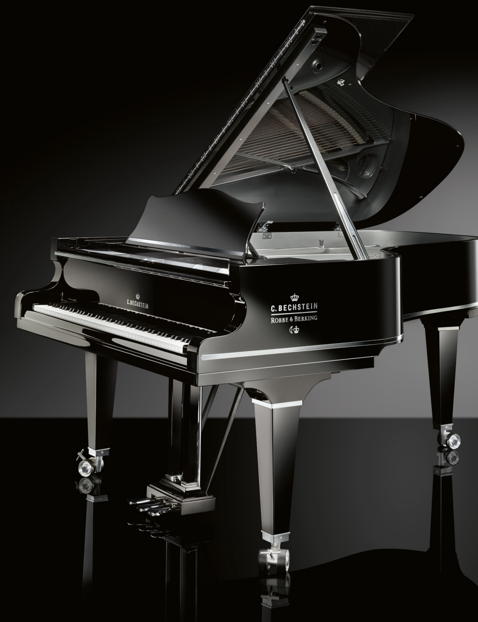
B 212 Sterling